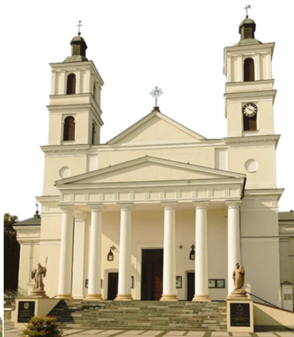
Kościół pw. Św. Aleksandra