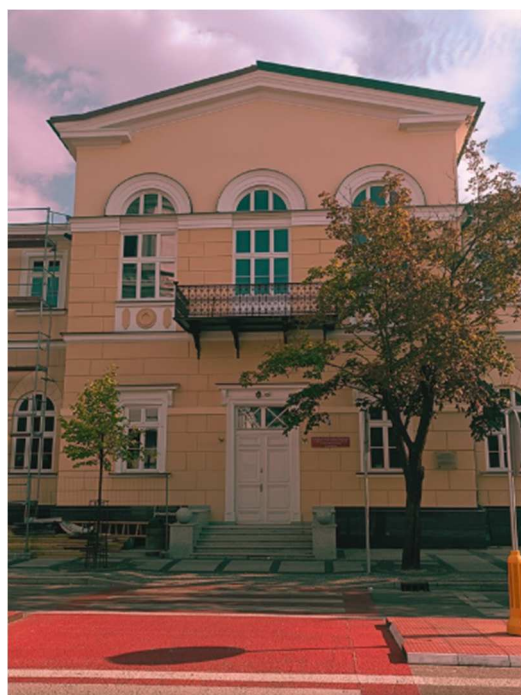
Liceum im. Marii Konopnickiej