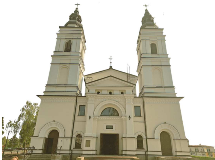
Kościół pw. Św. Piotra i Pawła (dawny kościół garnizonowy)