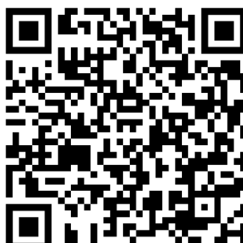
Liceum Ogólnokształcące im. Marii Konopnickiej