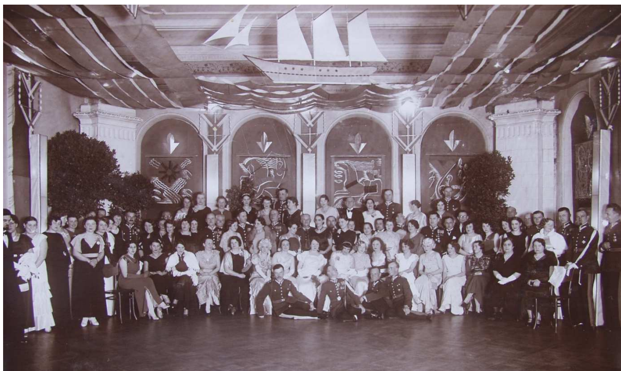
Bał Morski w Resursie Obywatelskiej, ok. 1935 rok

Zadanie publiczne "Śladami Historii - odkryć i ocalić dziedzictwo historyczno-militarne Suwałk" jest współfinansowane ze środków otrzymanych od Ministerstwa Obrony Narodowej