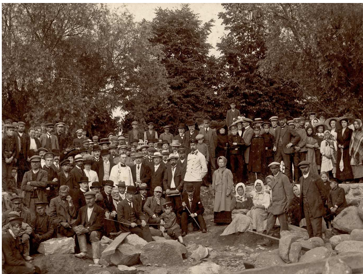
Uroczystość położenia kamienia węgielnego pod gmach Resursy Obywatelskiej, 20 lipca 1912 roku