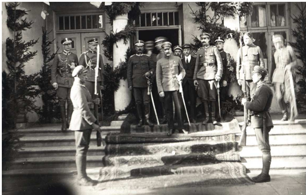
Naczelnik Państwa Józef Piłsudski przed wejściem do budynku Resursy Obywatelskiej 13 września 1919 roku