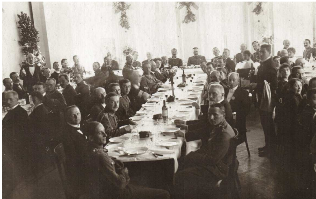
Uroczysty obiad z udziałem Józefa Piłsudskiego w Resursie Obywatelskiej, 13 września 1919 roku